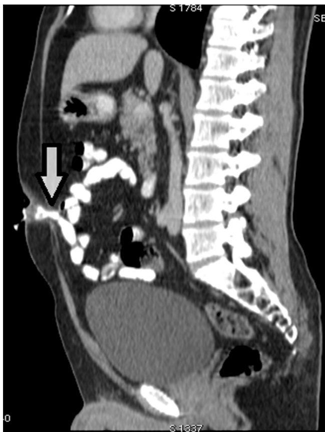
FIGURA 1 - Tomografia contrastada mostra intestino fistulizado na hérnia umbilical e na camada externa da pele umbilical

de líquido bem limitado de 1,5x1,5 cm por via subcutânea, sob o umbigo. Tomografia computadorizada abdominal com contraste revelou pequeno segmento subcutâneo de intestino que encontrava-se na fáscia umbilical. O intestino fistulizou em toda a hérnia umbilical e na camada externa da pele (Figura 1). Com os achados clínicos e radiológicos, o paciente foi inicialmente diagnosticado como portador de fístula enterocutânea com divertículo de Meckel. Na operação, o abdome foi aberto e a exploração revelou divertículo de Meckel (que encontra-se por via subcutânea) e uma fístula entre ele e o umbigo. Não houve contaminação do fluído no abdome. Foram realizadas diverticulectomia e excisão incluindo a fístula e umbigo (Figura 2). O paciente recebeu alta no quinto dia de pós-operatório de forma segura. Exame histopatológico confirmou divertículo de Meckel.