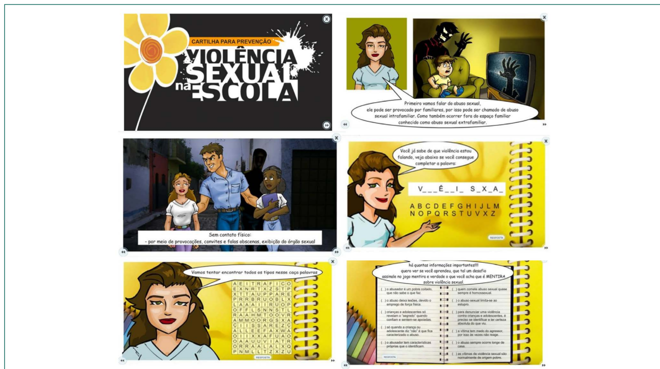
Figura 2. Algumas telas da cartilha digital “Cartilha para prevenção: violência sexual na escola”