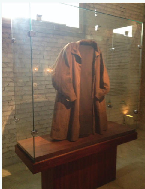
Manto de José de Anchieta. Capela do Pátio do Colégio, São Paulo.

Segundo informação explicativa fornecida no local da exposição, em 1760, o Marquês de Pombal ordenou que fosse enviado a Portugal um baú de jacarandá, contendo ossos humanos e um manto de tecido castanho-claro que teriam sido de José de Anchieta. Teria sido esse o manto mostrado na foto abaixo.