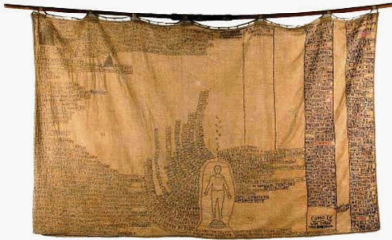
Estandarte. Bispo do Rosário

(Ao pé da figura humana, pode-se ler: "Eu preciso destas palavra escrita.")