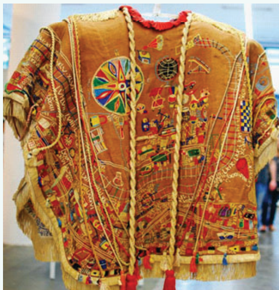
Manto da Apresentação (costas). Bispo do Rosário