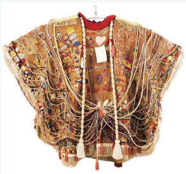
Manto da Apresentação. Bispo do Rosário.

A contraposição dos dois mantos, os quais alegorizam dois diferentes mundos letrados, pode ser pensada já a começar da própria expressão linguística. Em: “manto de José de Anchieta” e “manto de Bispo do Rosário”, há uma diferença de sentido em função do preenchimento do núcleo do sintagma preposicional “de fulano ” por um ou por outro nomes próprios: a expressão indica posse no caso de “manto de José de Anchieta”, mas posse e autoria no caso de “manto de Bispo do Rosário”. No primeiro, observa-se uma manufatura produzida segundo o molde de uma série; no segundo, uma produção artesanal única. Por sua vez, os espaços museológicos em que estão expostos (Capela do Pátio do Colégio, em São Paulo, e Museu do Inconsciente, no Rio de Janeiro) imprimem igualmente, em ambos, a memória de seus usos.