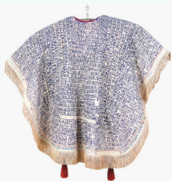
Manto da Apresentação (avesso). Bispo do Rosário