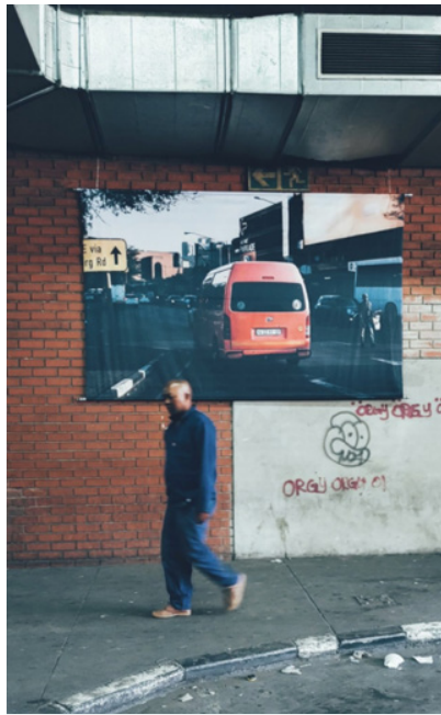
Figura 4. Série Bree Taxi Rank, 2019.

Fazer parar, fazer ver. Apropriar-se do espaço e das imagens. Apropriar-se de uma africanidade e de uma negritude desejadas. Os trabalhos de Neto são, como ele afirma, para todos. Mas dialoga diretamente com a população negra sul-africana. Não que isso o afaste do espaço das galerias e do mercado de arte. Mas até nesse caso é possível perceber os rastros da segregação racial na África do Sul na atualidade. Como jovem artista, Neto tem sido atualmente convidado para expor em galerias em áreas majoritariamente negras. Por um lado, isso seria coerente com seu desejo de contar histórias de seu povo para seu povo. Por outro, deixa entrever as barreiras materiais e simbólicas ainda existentes na Joanesburgo pós-apartheid que desafiam Neto a continuar a lutar e a r/existir. Seus projetos tornam esses espaços uma arena de discussão política e estética sobre o corpo, a cidade, a negritude, que recusa os estereótipos do afro-pessimismo 7 (VAN DER VLIES, 2012). Constituem um trabalho que deve ser de fato interpretado como “africano”, que sai dos regimes lineares de temporalidades e confabula as diferenças, identificando novas formas e articulações de poder.