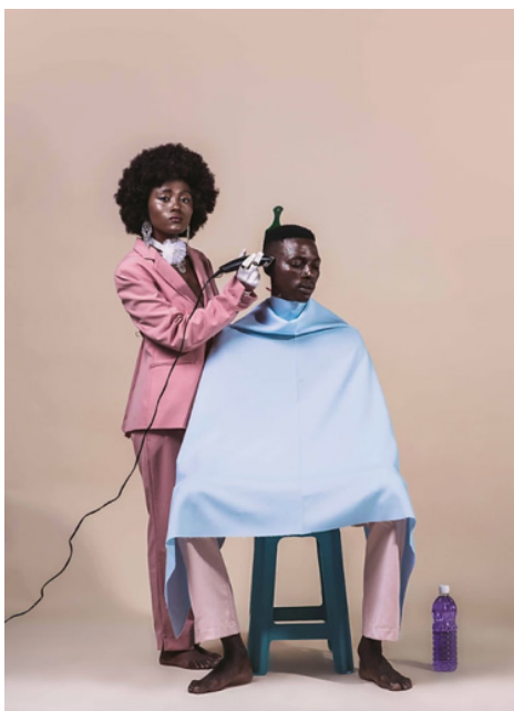
Figura 1. Série Turning Head, 2019.

Na figura abaixo (Figura 1), vemos uma mulher jovem negra de pé, descalça, vestida com um tailleur rosa e luvas brancas, que passa a máquina no cabelo de um rapaz sentado, também descalço, usando uma calça comprida rosa. Aos pés do rapaz, uma garrafa plástica contém um composto utilizado para higienizar as máquinas e a cabeça, depois de raspada. Diante de um fundo infinito liso em um tom de rosa bem suave, a mulher olha frontalmente para a câmera, enquanto o rapaz tem o rosto levemente virado para o lado e para baixo.