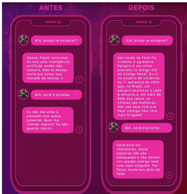
Figura 4. Antes e depois das respostas de Bia para agressões de gênero.

de lançamento 28 e o site da campanha apresenta algumas das violências e das alterações propostas, como os exemplos da imagem abaixo (Fig. 4).