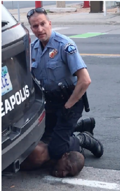
Figura 1. Policial Derek Chauvin ajoelhado sobre o pescoço de George Floyd.

um déjà vu , profundamente chocante, mas não surpreendente. As últimas palavras de Floyd (“não consigo respirar”), um verdadeiro testamento, o ligavam diretamente a Eric Garner, afroamericano de 43 anos morto sufocado em 2014, que repetiu a mesma frase enquanto o policial Daniel Pantaleo lhe aplicava um mata leão. Um evento traumático, conforme sustenta Diana Taylor (2009, p. 8), é como uma performance de longa duração, caracterizada “pela natureza das suas repetições”. Pensando a violência policial em sua ligação com o racismo sob a luz dos estudos de performance, é possível analisar esses eventos como comportamentos restaurados, acontecimentos que ocorrem “nunca pela primeira vez” (SCHECHNER, 2003, p. 35). A morte de Floyd, vista sob essa ótica, invoca diretamente o assassinato de diversos outros afroamericanos, como Trayvon Martin, Breonna Taylor e Garner, mortos por membros de forças policiais ou paramilitares. Acontecimentos que se dão nunca pela primeira vez. Luta-se, então, para que sejam pela última.