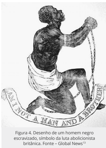
Figura 4. Desenho de um homem negro escravizado, símbolo da luta abolicionista britânica.

Uma outra imagem, símbolo da luta abolicionista britânica e que representa um homem negro escravizado de joelhos (Fig. 4), também foi, mesmo que de forma indireta, associada aos protestos iniciados por Kaepernick. É pertinente observar nessas associações uma idealização do gesto de Kaepernick, uma vez que a manifestação inicialmente foi realizada com o jogador sentado durante o hino nacional e a decisão de se ajoelhar veio por conselho de Nate Boyer e como uma forma de se antecipar a acusações de desrespeito com a bandeira ou de antipatriotismo — queixas que, de todo modo, foram e continuam sendo feitas.