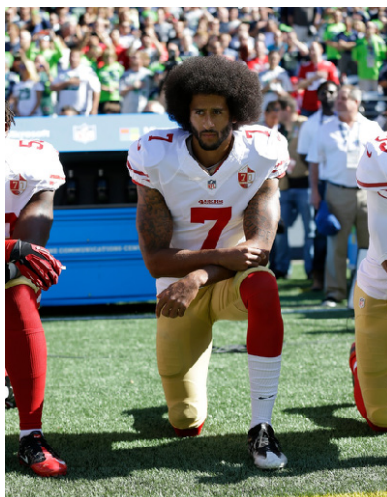
Figura 2. Colin Kaepernick protesta ajoelhado durante a execução do hino dos Estados Unidos. 9

à revisão, sempre passível de reinvenção; repetição que nunca se oferece da mesma maneira, mesmo quando sustentada pela constância da transmissão” (MARTINS, 2003, p. 66). 9