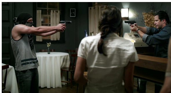
Figura 3. O assalto ao restaurante vira banho de sangue.

A essa altura, apenas 20 minutos se passaram, mas uma miríade de tensões sociais de múltiplas naturezas já está desenhada na tela, em um exemplo discreto e quase minimalista — tudo acontece, afinal, em tempo real e numa única locação — de economia narrativa. O cenário está pronto para a tragédia, sem criar um estudo de personagem. Afinal, Inácio é um homem de meia-idade que sente pressões vindas de todos os lados: a família o quer mais presente, os cozinheiros pedem compreensão, o restaurante está com dívidas, o chef reclama da hostilidade (que tem subtexto sexual), os clientes ordenam subserviência, a garçonete deseja atenção. A reação de Inácio ao anúncio do assalto é descarga de pressão, mas também manifestação do “homem cordial” (Figura 3).