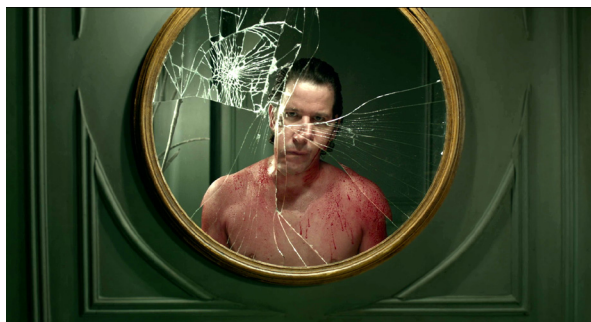
Figura 1. Inácio diante do espelho.

Enquanto isso, Sara circula entre o salão principal, o balcão de recepção (onde está Inácio) e a cozinha, e é tratada rispidamente — ou simplesmente ignorada — por todos (com exceção de um ajudante da cozinha, que flerta com ela). O olhar baixo, os ombros caídos, a maquiagem borrada, o cabelo amarrado num rabo-de-cavalo fora de moda enfatizam que é uma mulher sem autoestima. Ou, pelo menos, é isso que intuímos ao longo do primeiro ato. Enquanto ela caminha silenciosamente por entre as salas, Inácio recebe uma ligação da esposa, que o pressiona para chegar mais cedo em casa — mais um foco de tensão para ele, uma bomba-relógio prestes a explodir. Diante do espelho, ele ensaia sorrisos falsos e frases fabricadas (Figura 1) para receber um jornalista na semana seguinte, em uma imagem que lembra bastante os trejeitos premiados do ator Joaquin Phoenix em Coringa ( Joker , Todd Phillips, 2019), um filme que também admite uma leitura interpretativa sobre choque de forças sociais, embora não pertença ao gênero horror. Inácio quer dar a recepção mais intimista e cordial possível ao repórter, pois sabe que uma crítica positiva ao restaurante pode reduzir seus problemas. A tensão se acumula mais e mais.