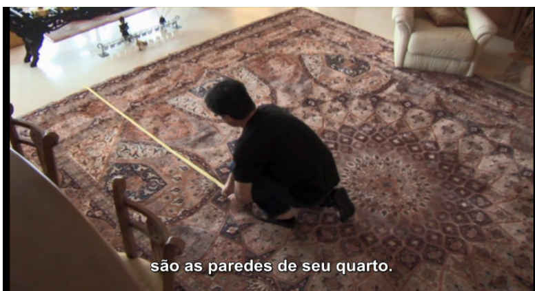
Figura 1. Jafar Panahi usa fita adesiva para criar um cenário.

Esse roteiro conta a história de uma garota, Maryam, que foi aprovada para entrar em uma universidade, mas seus pais não aceitam que ela siga uma carreira fora das tradições familiares e a aprisionam no quarto, a fim de que ela não se matricule. Guardando relações de proximidade com a situação de enclausuramento do próprio Panahi, ele e o amigo decidem filmar um processo de leitura dramatizada do roteiro. Usando os cômodos de sua casa, Panahi interpretará os diálogos de todos os personagens e lerá as rubricas de situações, espaços e ações, construindo o espaço de clausura de Maryam a partir de seu próprio espaço prisional. Colocando fitas adesivas no chão da sala de estar, o diretor demarca os espaços da casa em que acontecem as situações do roteiro, situando o espectador no espaço físico interno da casa (portas, janelas, corredores etc.) e externo (rua, calçada, beco etc.). Enquanto isso, Mirtahmasb filma Panahi assumindo as posições que seus personagens ocupariam no cenário, que vai sendo imaginado a partir da leitura das rubricas, como aparece na Figura 17.