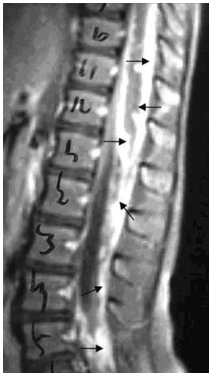
Figura 2 - Lesão disseminada pelo espaço subaracnóideo raquidiano, exercendo compressão ao nível do cone medular