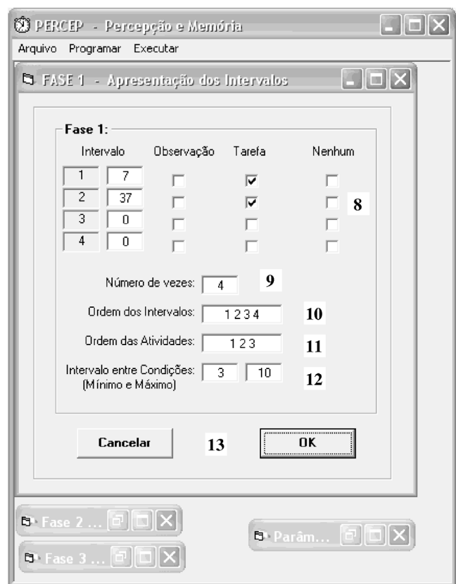
Figura 2. Tela de configurações da Fase 1 – Apresentação dos Intervalos – do programa "PERCEP"; os números indicam itens cuja função é detalhada no corpo do texto

7. Botões OK e Cancelar : o botão "Cancelar" fecha a respectiva tela; o botão "Ok" registra e armazena as configurações determinadas.