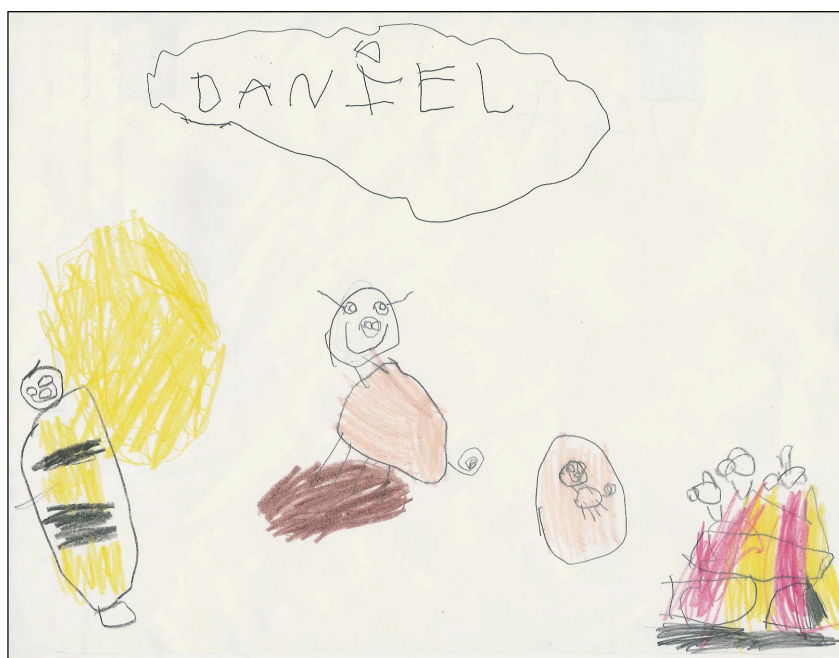
Figura 1. Caso 1

“Era uma vez um porquinho que um dia teve um filhotinho e teve um OVO bem grande, daí as abelhas roubaram, daí o policial pegou e roubou das abelhas e daí fez churrasquinho das abelhas e acabou”.