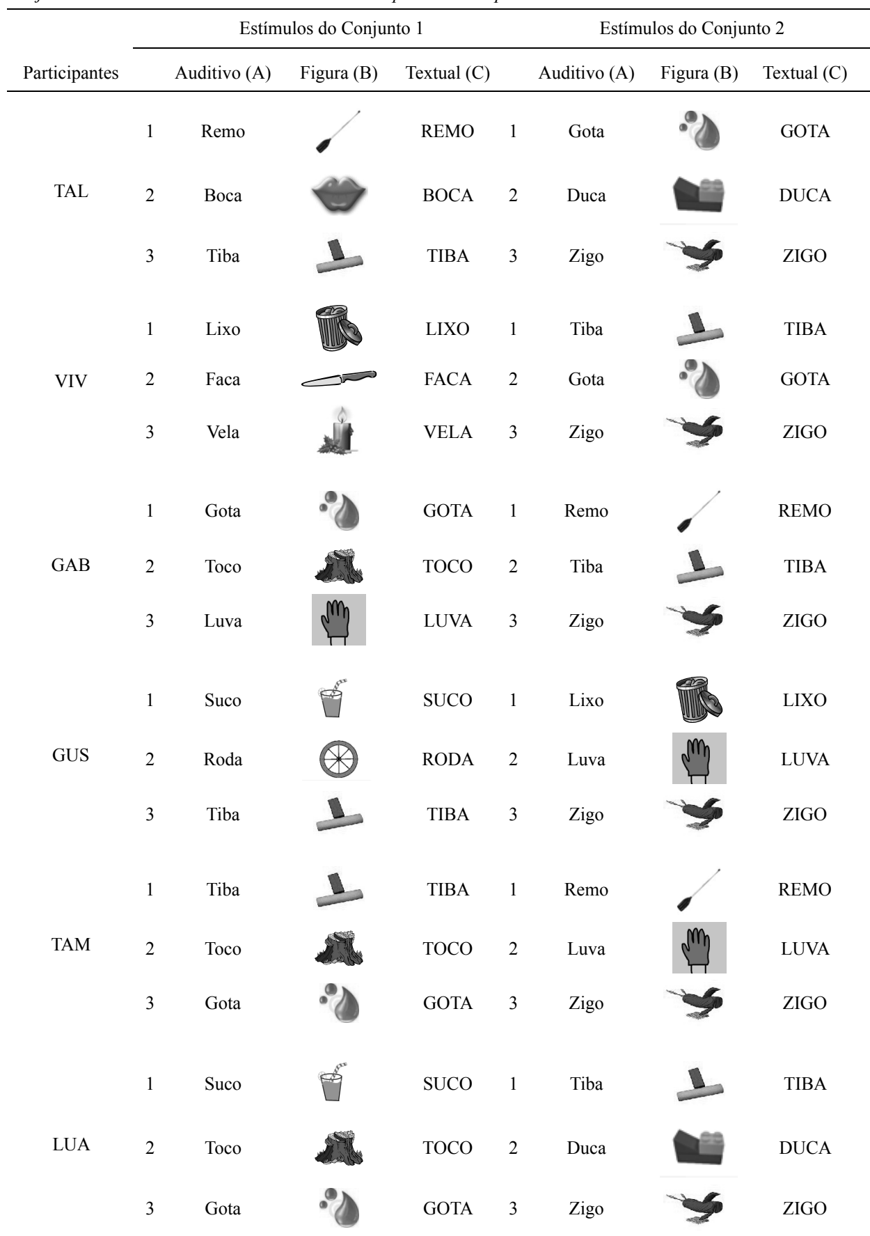
Tabela 2 Conjunto de Estímulos Utilizados com Cada Participante nas Etapas de Ensino e Teste