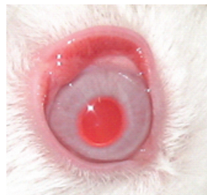
Figura 2: Olho após 24 horas de tratamento com óleo essencial de Origanum vulgare 3%, demonstrando hiperemia conjuntival discreta

Ao realizar o teste de irritabilidade ocular primária com o óleo essencial de Origanum vulgare a 3%, evidenciou-se alteração nas conjuntivas na avaliação oftalmológica realizada após 1 hora de instilação da substância (coloração púrpura difusa em um dos animais incluídos no estudo). No exame realizado após 24 horas de uso tópico do óleo essencial, evidenciou-se apenas hiperemia discreta em um dos animais do estudo (Figura 2). Não foram evidenciadas outras alterações oculares em nenhum dos outros tempos de avaliação preconizados neste teste. A média máxima foi de 1,33, classificando o óleo essencial nesta concentração como praticamente não irritante (Quadro 4)