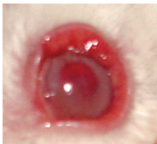
Figura 3: Conjuntiva de olho de coelho, após 1 hora de contato com óleo essencial de Origanum vulgare a 9%, com coloração vermelha fartamente distribuída

Nos exames histopatológicos, nenhuma alteração microscópica foi observada nos olhos dos animais utilizados pelo estudo.