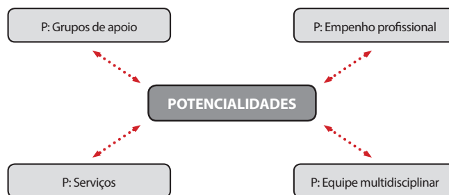
Figura 1 - Potencialidades da rede intersetorial

O município conta com a DEAM e hospital, que presta atendimento de ponta nas questões de saúde vinculadas a esse tipo de situação. (PPAP1)